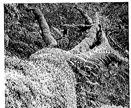
Bemooster Baumstamm am Wegesrand.

ZAHLREICHE AUFSTIEGSMÖGLICHKEITEN. Nicht nur das bunte Erscheinungsbild des westlichen Wienerwaldes ist einen Besuch wert – auch die zahlreichen Aufstiegsrouten reizen. In rund zweieinhalb Stunden (kurze Routenbeschreibung siehe rechts) geht es etwa von Kreisbach über die Zehethofer Höhe zur Stockerhütte. Traisen (1 Std.), Schwarzenbach (1 ¼ Std.) und St. Veit/Gölsen (1 ¼ Std.) bieten sich als weitere Basislager mit entsprechender Infra-