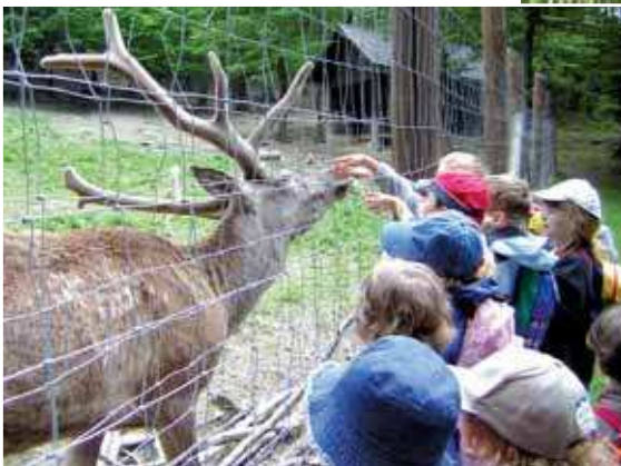
Wildgehege und Buchenwald in Purkersdorf.